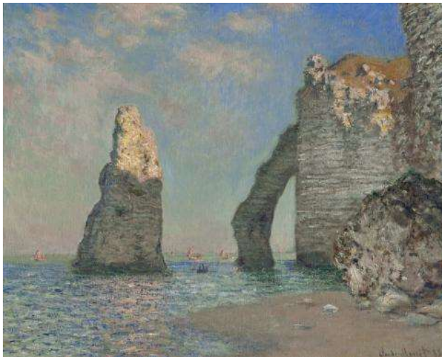
Claude Monet, Étretat. Die Felsnadel und das Felsentor von Aval, 1885 Öl auf Leinwand, 65,1 x 81,3 cm, Clark Art Institute, Williamstown, acquired by Sterling und Francine Clark, 1933, Foto © The Clark Institute

Der Küstenort Étretat ist ein Sehnsuchtsort, der bis heute fasziniert. Die Felsen von Étretat an der Atlantikküste der Normandie zogen im 19. Jahrhundert zahlreiche Künstler in ihren Bann.