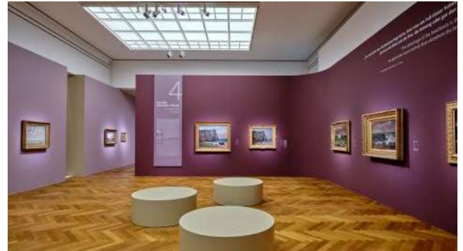
Ausstellungsansicht »MONETS KÜSTE. DIE ENTDECKUNG VON ÉTRETAT«