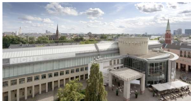
Schirn Kunsthalle Frankfurt

Für die Präsentation konnte die SCHIRN bedeutende Leihgaben, u.a. aus dem Centre Pompidou, Musée national d'Art moderne, Paris, dem Tel Aviv Museum of Art, The Metropolitan Museum of Art, New York und der Tate Modern, London zusammenführen.