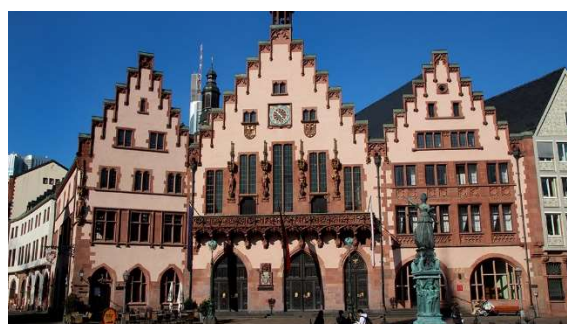
Rathaus; Römer, © Stadt Frankfurt am Main, Foto: Stefan Maurer

Eine Veranstaltung des Förderkreises Städtische Galerie/Museum Neunkirchen e.V. in Zusammenarbeit mit der VHS Neunkirchen.